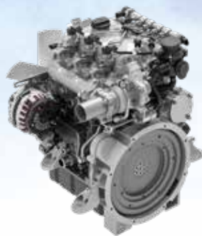
Hatz Motoren ab 18,4 kW

Die Vorgaben der Emissionsstufe EU Stage V können Dieselmotoren über 19 Kilowatt Leistung nicht ohne Dieselpartikelfilter erfüllen. Hatz hat schon frühzeitig in der Entwicklung der neuen Motorengeneration der H-Serie diesen Weg eingeschlagen und ist somit gut für die Anforderungen heute und morgen gerüstet.